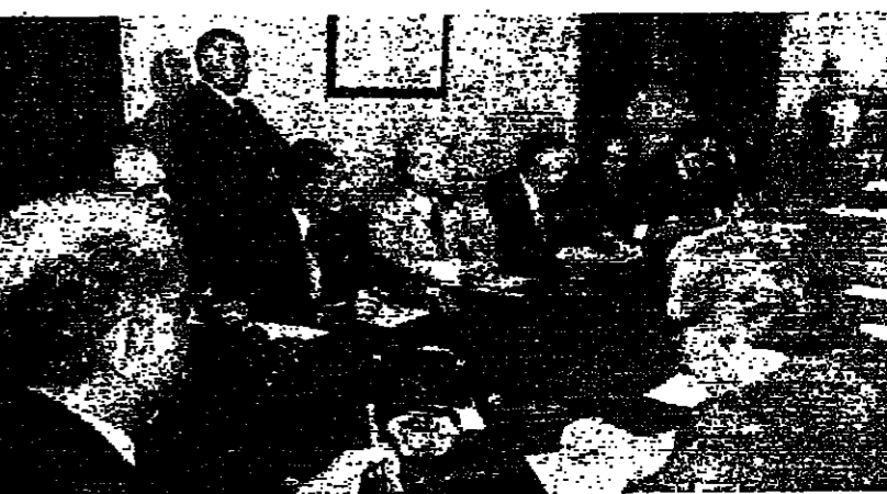
الرئيس كرامي يرأس اجتماع لجنة التنسيق الموسعة والى جانبه الرئيس الباشي، ويبدو مدير عام قوى الامن الداخلي السيد هشام الشمار، وقائد الدرك العميد جورج معلوف والسيد ابراهيم قنبلات (الى اليمين) والسيد عاصم قاصو ويمثلو سائر القادات

ترأس الرئيس كرامي اجتماعاً لهدنة الحوار الوطني التي تمت اول اجتماع لها بعد اعلان تشكيل الهدنة الامنية، وحضر الاجتماع جميع الاعضاء باستثناء وزير الداخلية الرئيس كميل شمعون. وكان متوقفاً ان يعقد الرئيس كرامي وشمعون اجتماعاً منفرداً أمس لتصفية رواسب الخلاف بينهما، لكن الاجتماع تجل الى اليوم.